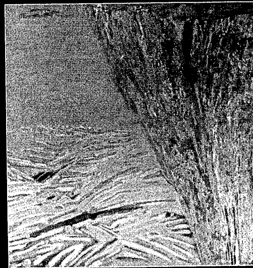
Björn Wessman: "Manifest II".

fugor av färg och beräknad form, dramatiska utspel och variationsrika formationer. De är i en mening moderna ikoner, visserligen med landskapet som utgångspunkt men vars essens, hela energin, kommer inifrån denna andlighet som särpräglar mycket av det han gör.